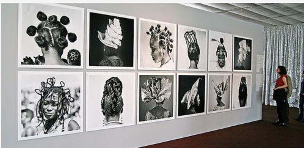
Documenta 12, 2007: Headgear Series. 1974-2004 (Gelatin silver print on aluminium, each 100 x 100 cm)